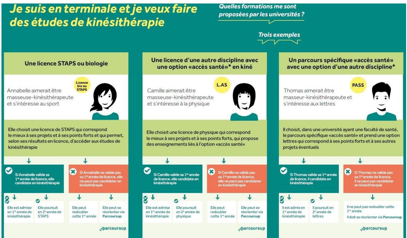
Figure 1 : infographie, je veux faire des études de kiné (ONISEP).

Pour y voir plus clair nous te conseillons de regarder ces infographies réalisées par l'ONISEP : « Kiné comment ça marche ? » ; « Je veux faire des études de kiné ».